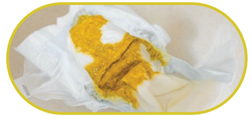
Heces amarillas (también pueden verse con semillas o acuosas)

Deberían tener de 4 a 5 pañales limpios y mojados por día para el día 4 de vida. Un pañal mojado pesa 3 cucharadas de agua en un pañal limpio.